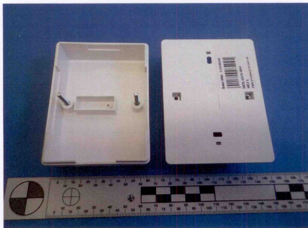
Modul montážních svorek MZ-2 L