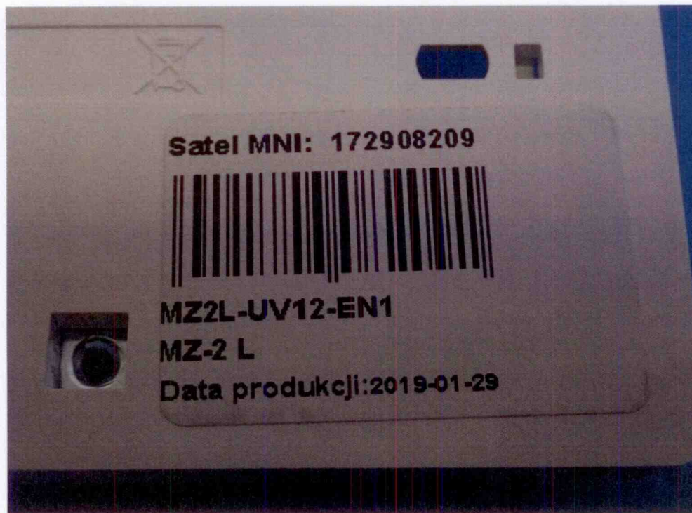
Modul montážních svorek MZ-2 L